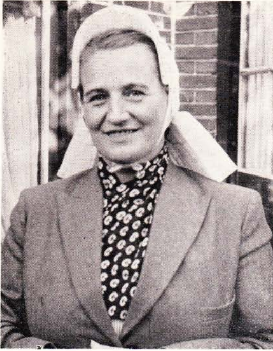
Een charmante Twentse. Ook bij een modern mantelpakje doet de Twentse knipmuts het uitstekend. (Zie pag. 16)